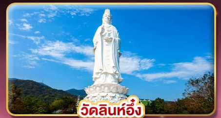
วัดลินห์อึ้ง